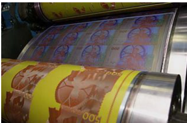
Offset simultáneo para los billetes suecos