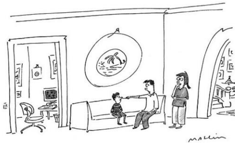
«Cariño, es muy importante que recuerdes adónde has transferido los fondos de papá y mamá.» Michael Maslin/The New Yorker Collection

que morimos (o, como mínimo, hasta que la senectud hace su aparición). Debemos muchos de los grandes logros de la humanidad a la tecnología desarrollada por el ser humano, como por ejemplo los relojes, la rueda, la máquina de vapor o los cohetes espaciales. Del mismo modo, buena parte de nuestros logros más aterradores también se derivan de tecnologías concebidas por el ser humano, como el arco y la flecha, la escopeta, las armas nucleares, los cohetes espaciales (de nuevo) o, más recientemente, los drones con los que cada vez se libran más batallas en lugares remotos.