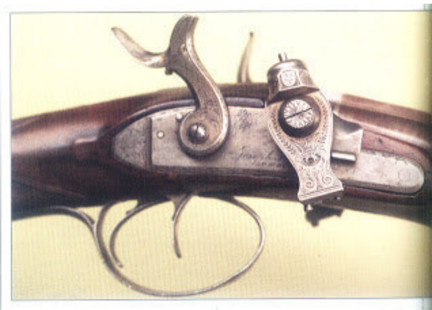
"Frasquito de Perfume"

(1768-1843). El más conocido de sus sistemas (1807) es el llamado hoy, por su forma característica, de "frasquito de perfume". Otro artificio que obtuvo una difusión bastante notable fue el de ignición de "tubo", ideado probablemente por el inglés Joseph Manton. Luego de este sistema de fuego acaece con el decisivo invento de la cápsula metálica y la "chimenea". Esta última es un pequeño cilindro perforado y roscado en una extremidad, que se atornilla sobre el oído y sirve de soporte a la cápsula, destinada a conducir la llamarada hasta la carga de la recámara. La cápsula, una copita de metal blando, conteniendo en su interior el fulminato, se introducía sobre la chimenea, y al explotar provocaba la deflagración de la pólvora negra contenida en el cañón. La invención de la cápsula, atribuida al angloamericano Joshua Shaw, señaló la desaparición del pedernal y fue la base de los sucesivos e importantísimos perfeccionamientos en los sistemas de ignición.